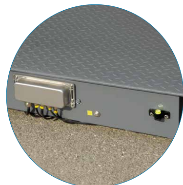
Scatola di giunzione in acciaio Inox Stainless steel junction box