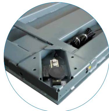
Particolare alloggiamento cella di carico Detail of load cell mounting